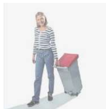
Carry handle Asa de transporte