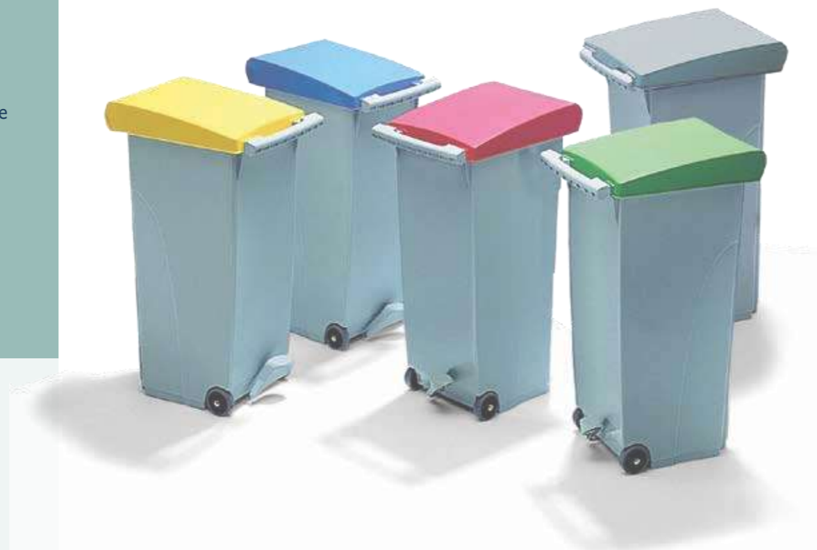
Bag attachment system Sistema de fijación de bolsas