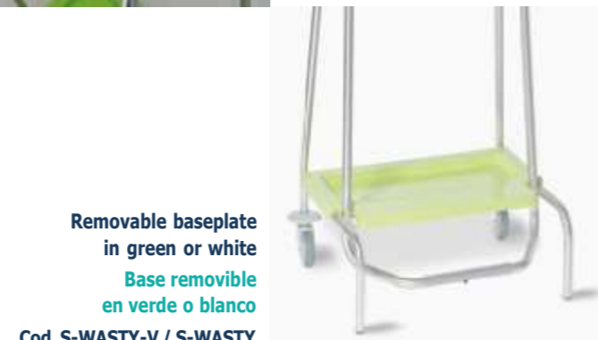
Removable baseplate in green or white Base removable en verde o blanco Cod. S-WASTY-V / S-WASTY