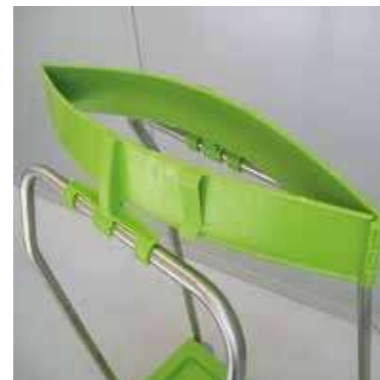
Bag retainer in plastic Retenedor de bolsas de plástico Cod. M-WASTY