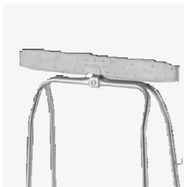
Bag retainer in steel and rubber Retenedor de bolsas de acero y goma Cod. W70110M