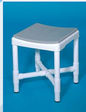
DH 49 PA Douchehocker, met bekleed zitkussen in grijs. Draagkracht 200 kg.