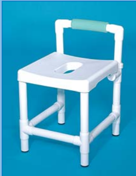
DH 49 RL Douchehocker met beklede rugsteun voor meer comfort en veiligere zithouding. Draagkracht 150 kg. Afgebeelde kleur: laguna.