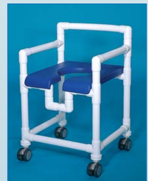
DH 100 PP Douchehocker (zie DH90 PP) voorzien van 4 blokkeerbare wielen. Afgebeelde kleur: felblauw. Draagkracht 150 kg (ook verkrijgbaar in XXXL versie met draagkracht 200 kg).