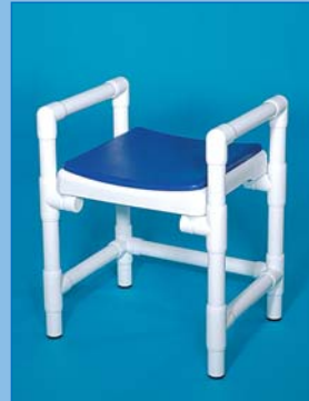
DH 49 A PA Douchehocker met stevige armleuningen. Draagkracht 150 kg. Afgebeelde kleur: felblauw.