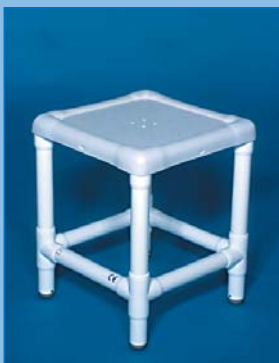
DH 55 Klassieke douchehocker met afneembare, voorgevormde zitting. Draagkracht 300 kg.