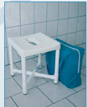
DH 49 R Het basismodel douchehocker voor op reis. Dit model kan in- en uit elkaar gehaald worden zonder gebruik van gereedschap (opbergtas bijgeleverd). Afmetingen: 43x43x19. Gewicht: 3,8 kg. Draagkracht 150 kg.