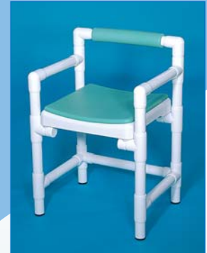
DH 49 A RL PA Douchehocker met armleuningen, beklede rugsteun en zitkussen. Draagkracht 150 kg. Afgebeelde kleur: laguna.