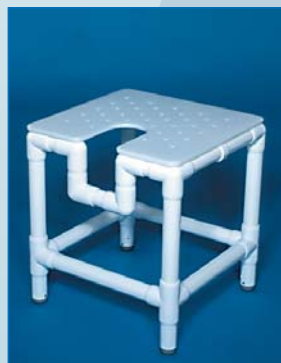
DH 56 De XL-douchehocker met geperforeerde zitting, voorzien van sanitaire opening. Draagkracht 300 kg.