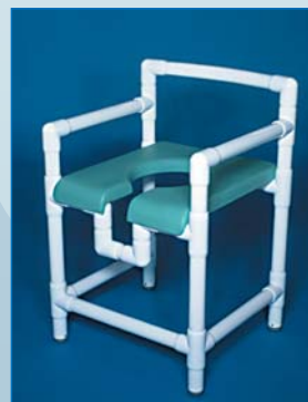
DH 90 PP Douchehocker met armleuningen en rugsteun en een comfortabele zitting met sanitaire opening. Afgebeelde kleur: laguna. Draagkracht 150 kg.